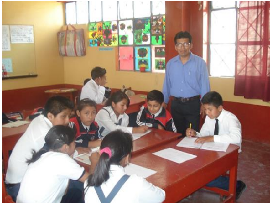
ESTUDIANTES DEL CEBA PUERTO MALDONADO