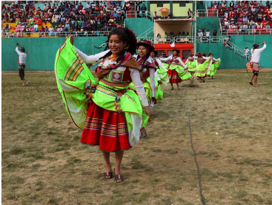
Figura 25 COREOGRAFÍA DE LA DANZA PANDILLA