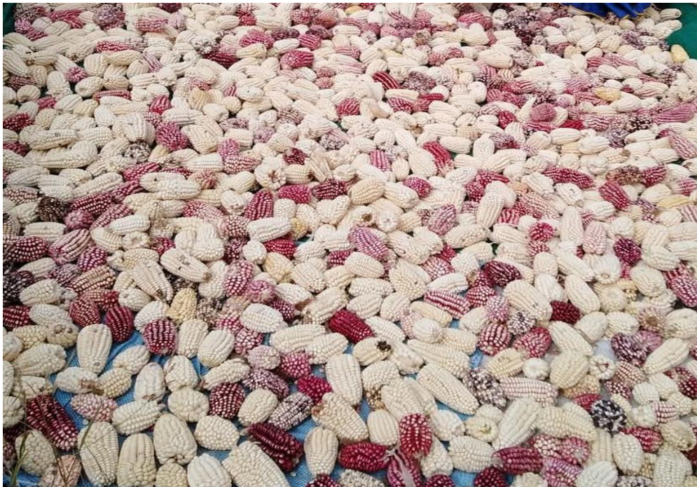
Figura 22 DISTRITO DE CHOJATA PRODUCTOR DE MAÍZ ORGÁNICO