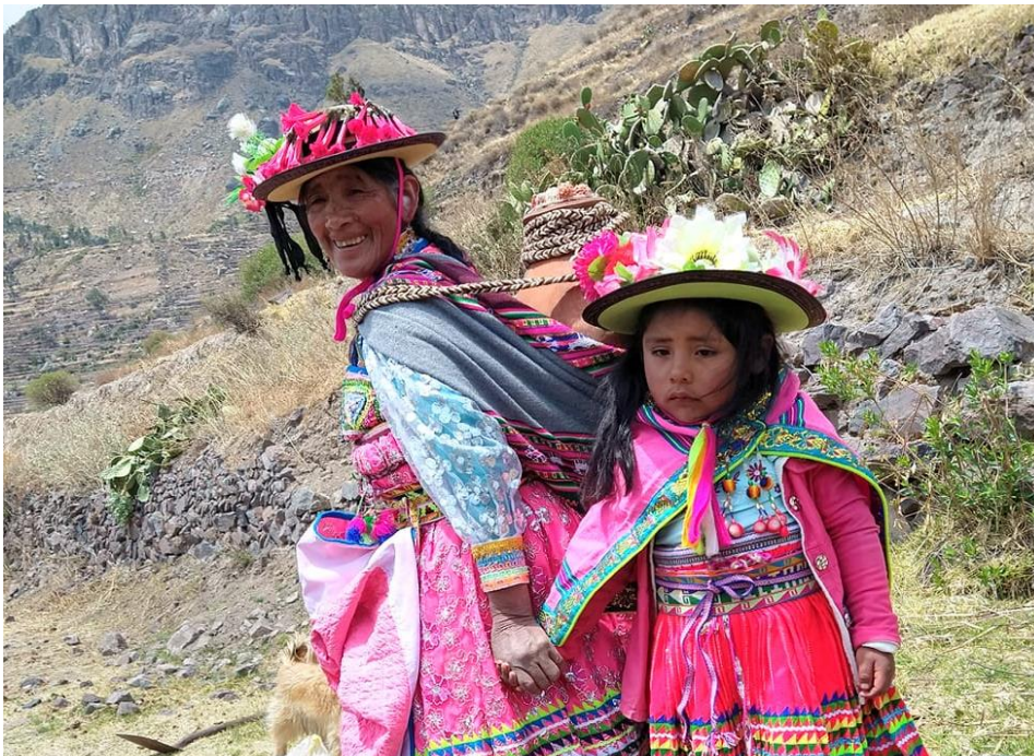
Figura 24 MUJER CHOJATEÑA CARGANDO CHICHA (AQHA)