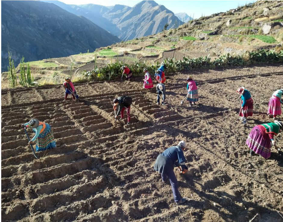
Figura 23 AYUDA MÚTUA EN LA SIEMBRA DE MAÍZ (AYNI)