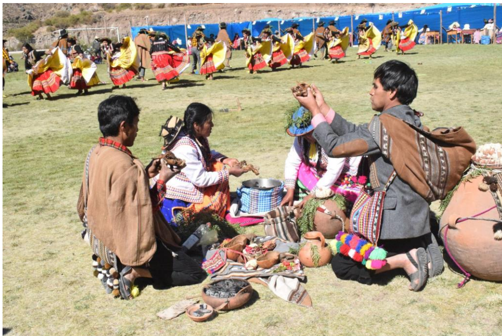
Figura 27 PARTICIPACIÓN DEL DISTRITO DE YUNGA EN EL I FESTIVAL DE SARA TARPUY Y LA CHICHA CHOJATA 2017