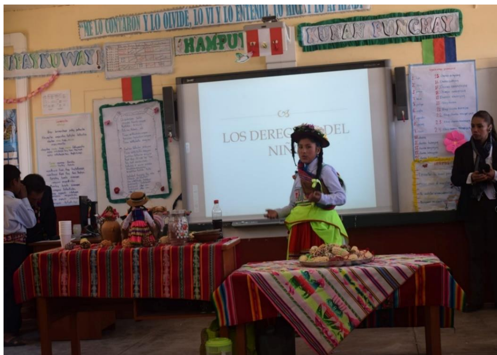
Figura 28 PRÁCTICA INTERCULTURAL EN EL AULA

Nota. Institución Educativa Túpac amaru II