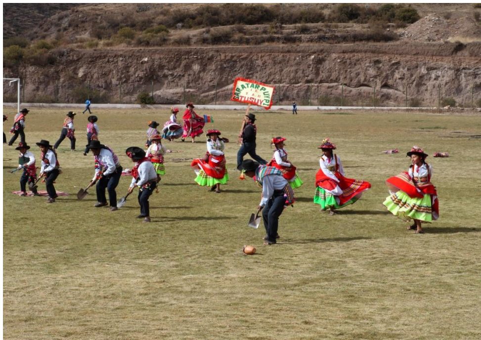
Figura 26 DANZA SARA TARPUIY