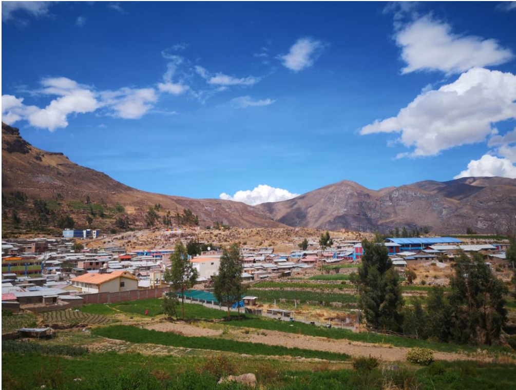
Figura 21 CHOJATA, VALLE SAGRADO DE LOS CAÑONES