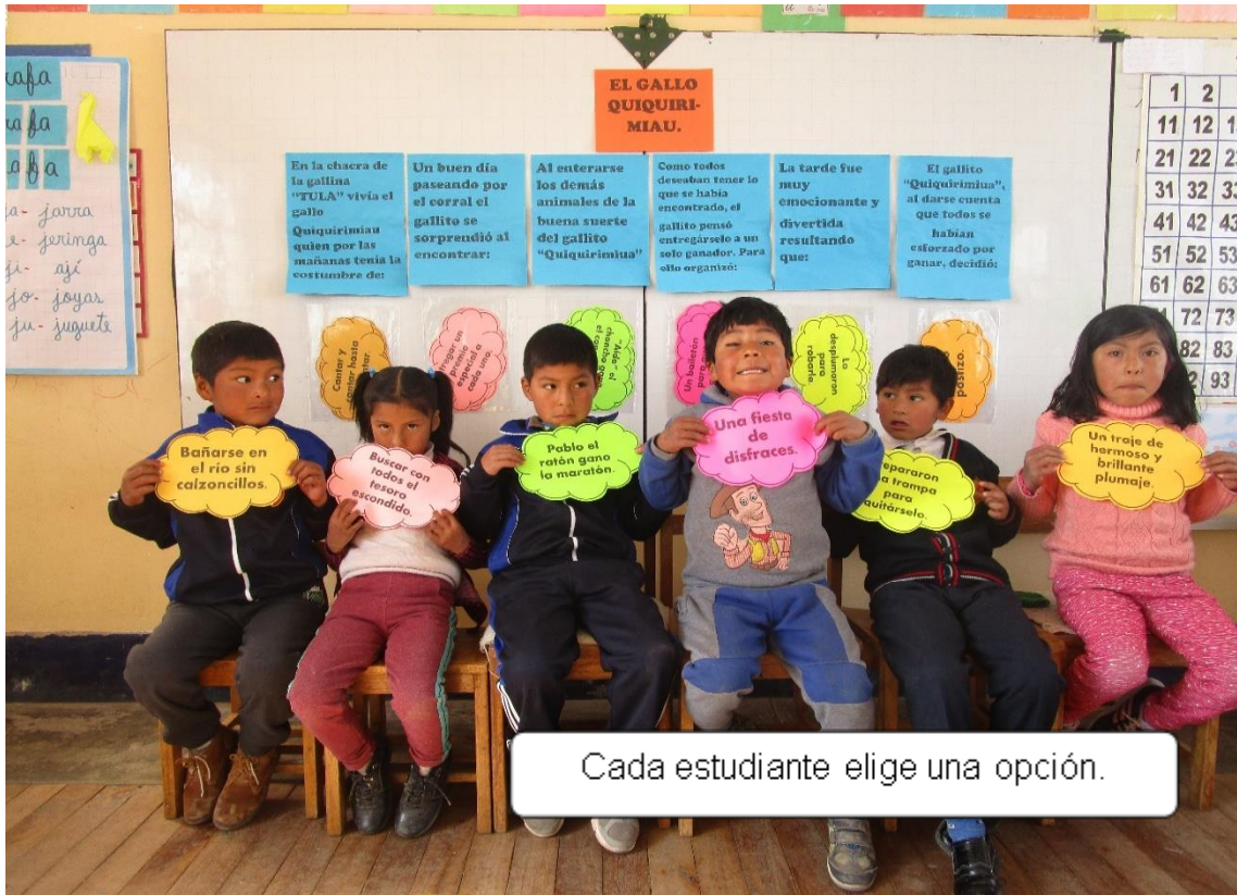
Figura 5. Cada estudiante elige una opción (Elaboración propio, 2019).