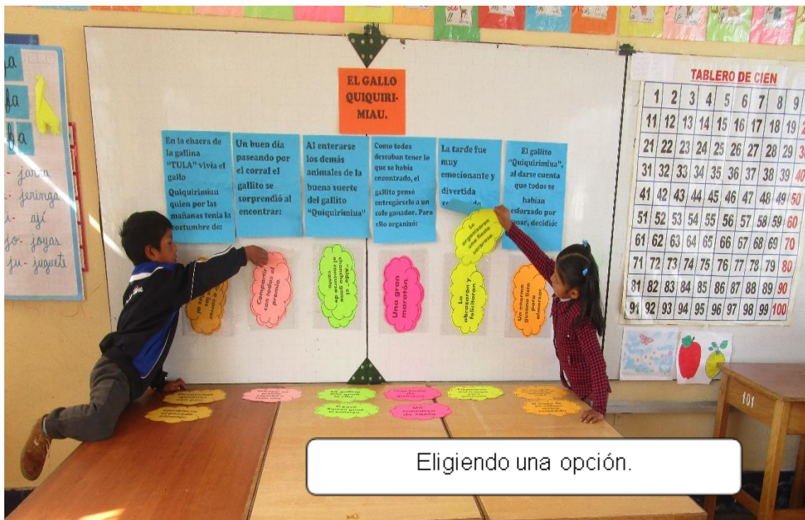
Figura 8. Niños eligiendo una opción (Elaboración propio, 2019).