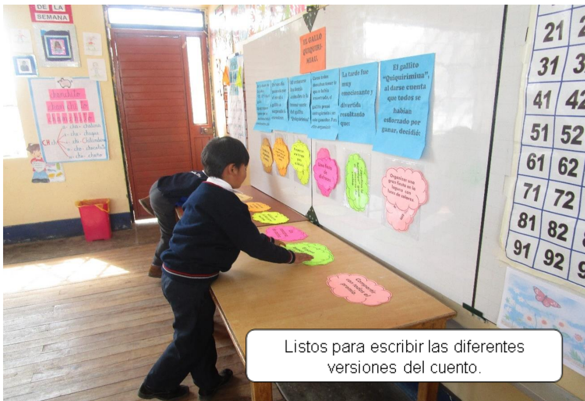
Listos para escribir las diferentes versiones del cuento.