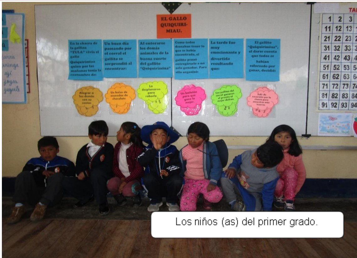
Figura 7. Niños del primer grado (Elaboración propio, 2019).