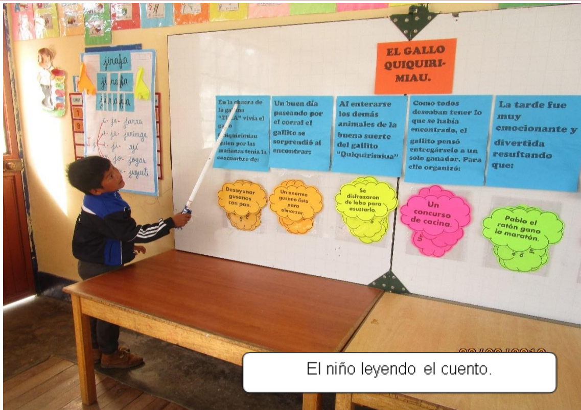
El niño leyendo el cuento.