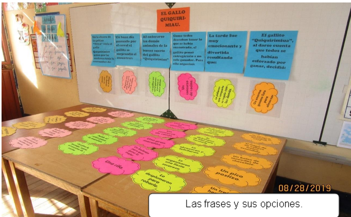
Las frases y sus opciones.