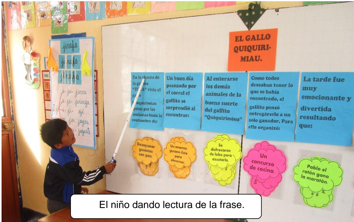
Figura 3. Niño dando lectura (Elaboración propio, 2019).