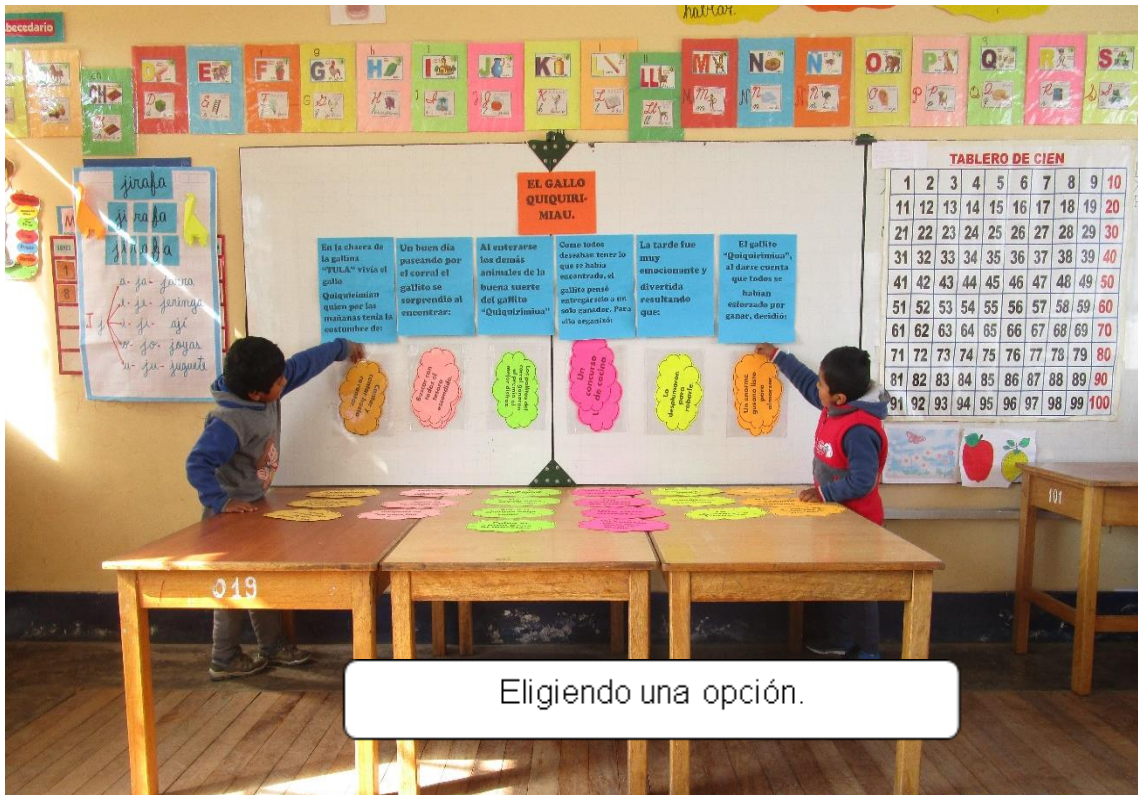
Figura 4. Niños eligiendo una opción (Elaboración propio, 2019).