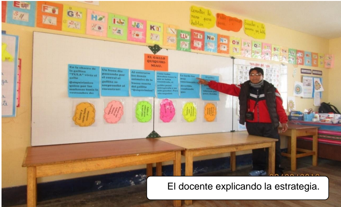
El docente explicando la estrategia.