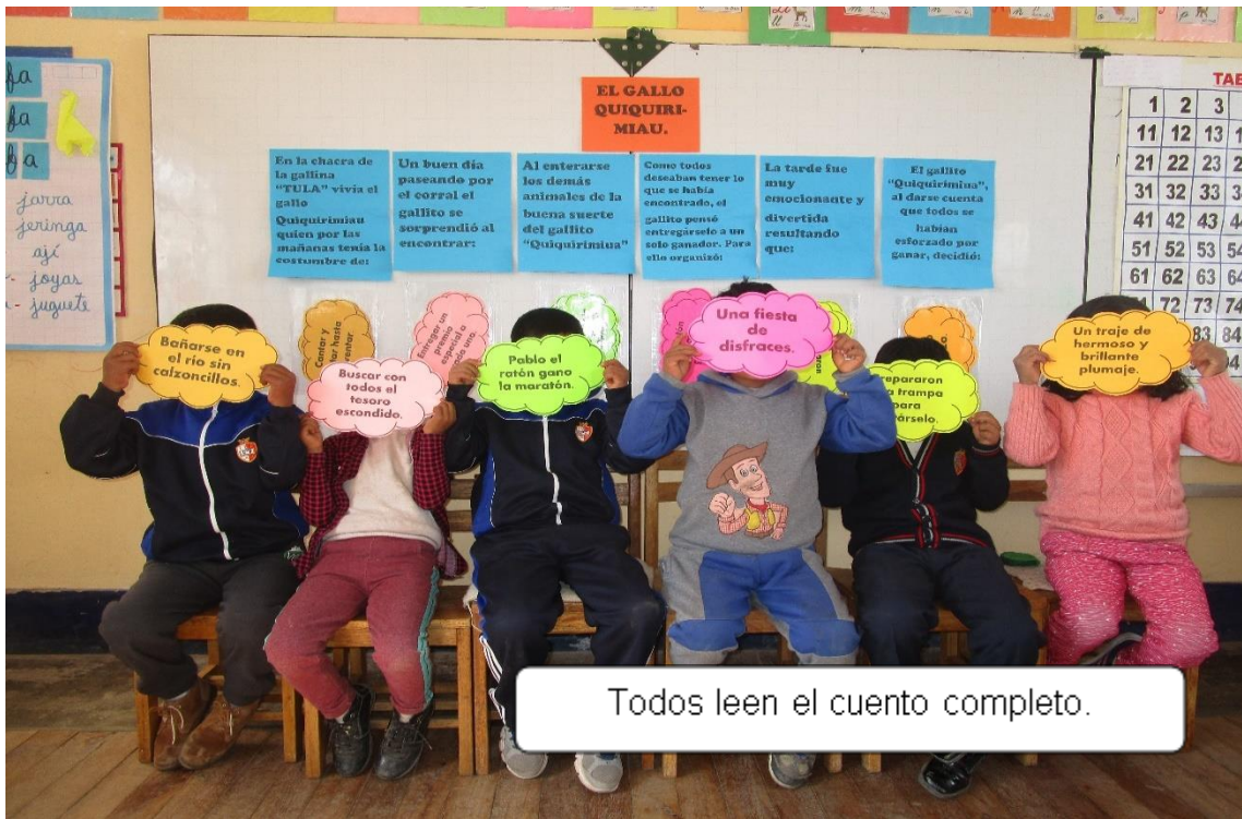
Figura 6. Todos leen el cuento completo (Elaboración propio, 2019).