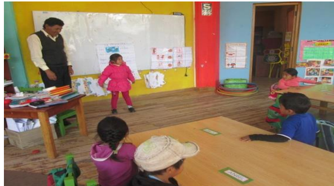
DESARROLLANDO LA EXPRESIÓN ORAL DE LOS NIÑOS