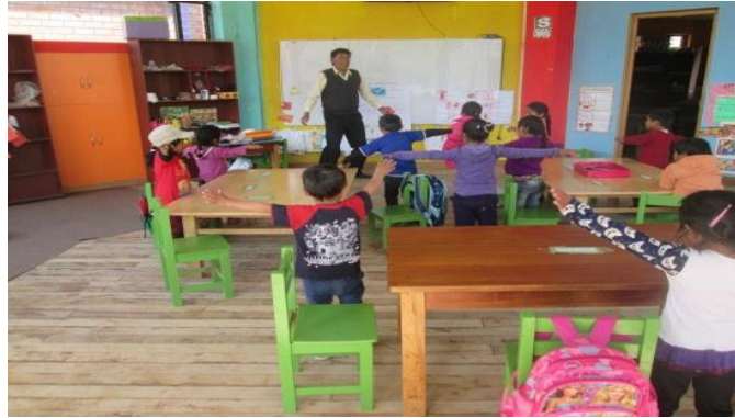
DESARROLLANDO LAS SESIONES CON LOS NIÑOS