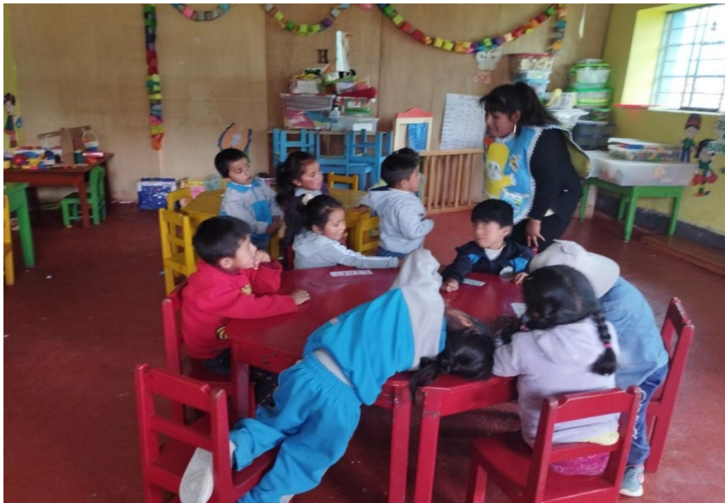
Comentando sobre los resultados del trabajo individual y grupal