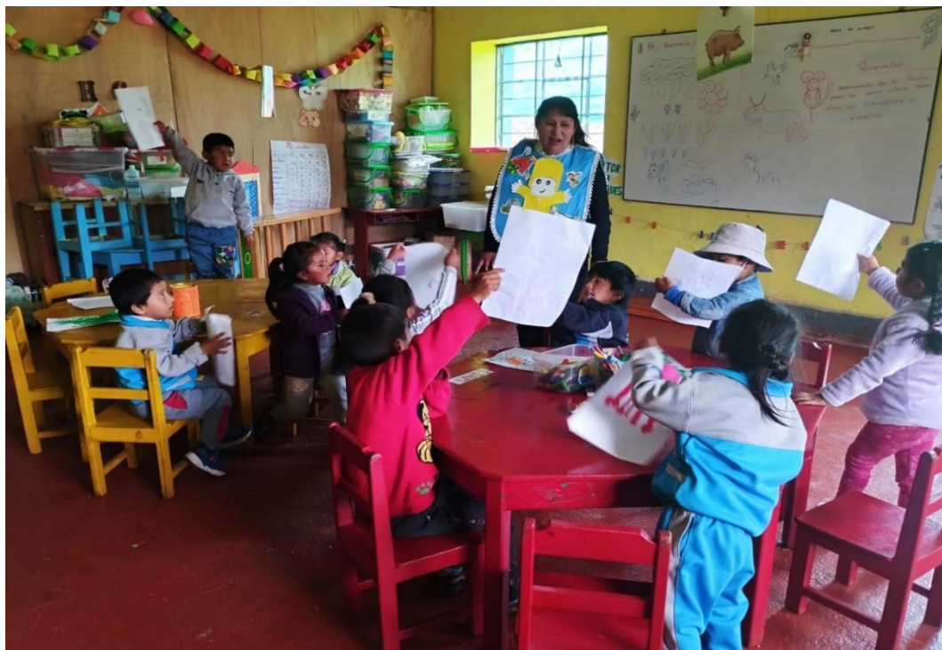
Monstrando los trabajo los niños de 5 años de edad