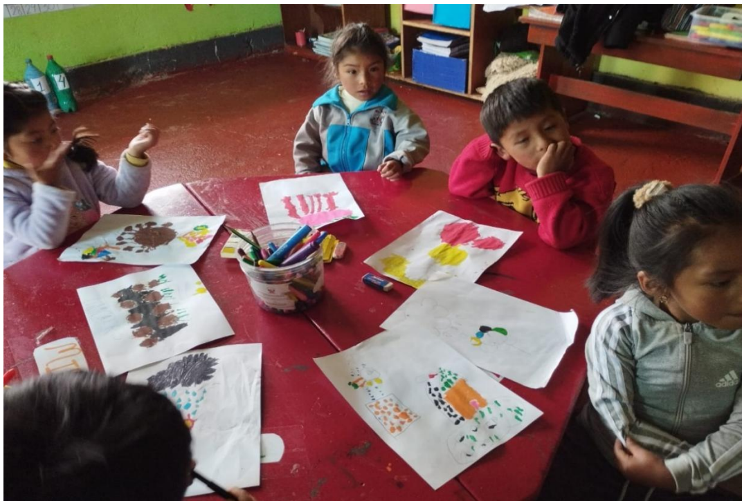
Exposición de trabajos en forma individual y grupal