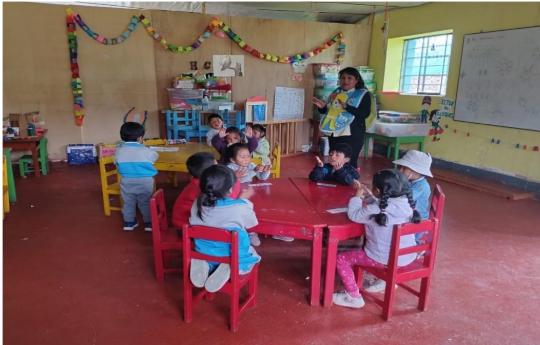
Docente y estudiantes desarrollando una sesión de aprendizaje