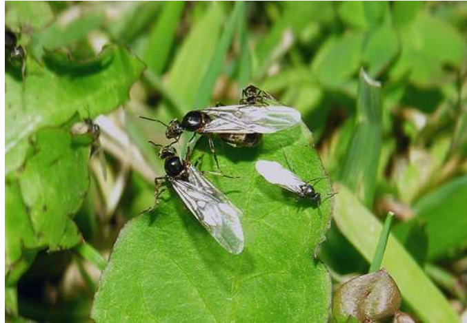
Ilustración 9 Las hormigas