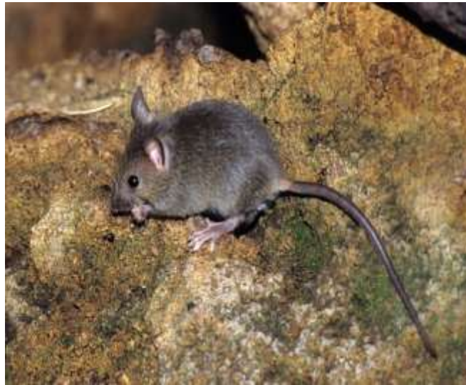
Ilustración 10 EL RATONCITO O HUQUCHA