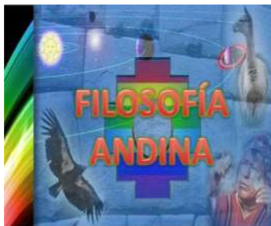
Ilustración 1 Filosofía Andina