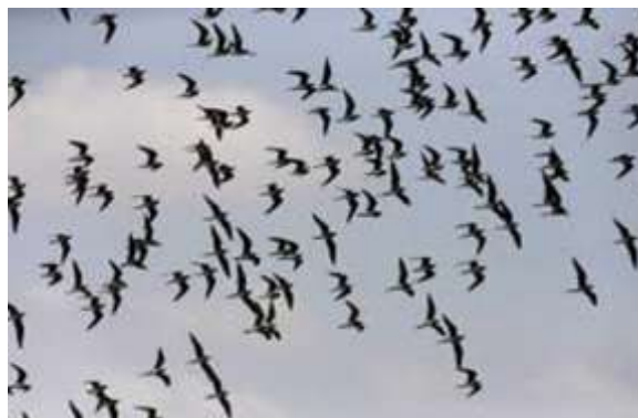
Ilustración 7 Garzas negras