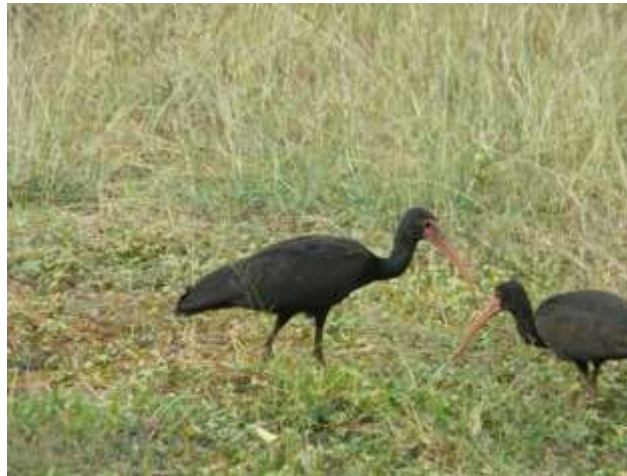
Ilustración 6 Garzas negras