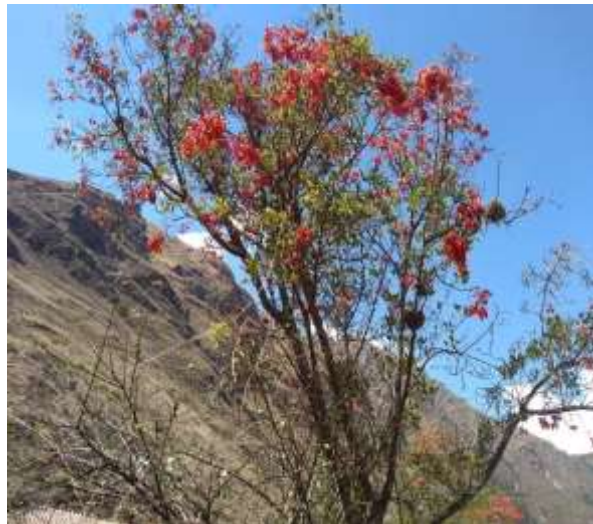
Ilustración 4 Árbol de pisonay

de rojo vivo y las hojas tienden a derramarse y aparece como si los árboles de pisonay fueran de color rojo mostrando sus hermosas flores que significan que ya hay que empezar a sembrar el maíz las papas, zapallos, calabazas aun en lugares donde no hay irrigación ósea son temporarios y los agricultores indican éstos árboles indican que la santa tierra la empezó a humedecer y habrá buena cosecha, y nos muestran hasta los arbolitos más pequeño florecen en este mes de agosto, indicando que ya deben empezar los sembríos.