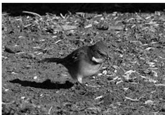
Ilustración 14 El Chuqllu Puquchi

puquchi que cantan enzima de las espigas o parwas eso significa que ya están apreciando los primeros choclitos y anuncian que muy pronto habrá choclos en la chacra.