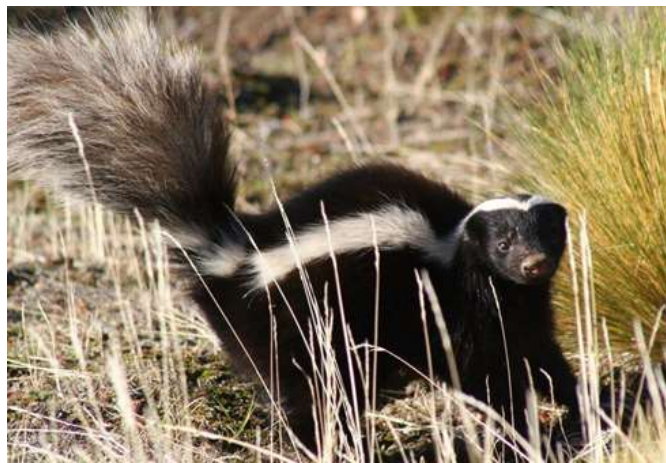
Ilustración 13 El zorrino o años

defenderse del enemigo los pobladores indican que hasta te tapa la respiración esto fuertes olores que emana el zorrino, este animalito predice o da una señal en apoyo a la agricultura, por dice en la noche visita la chacra en busca de insectos y escarba la tierra. También, dicen andan agujereando huecos en los cerros, al escarbar sacan grandes grumos o terrones de tierra o k'urpas de tierra eso significa que habrá buena producción de papas, y si del hueco sacaron terrones pequeños la producción de papas será menudas y muy poca los pastores siempre andan fijándose lo que hacen los zorrinos y dejan su mal olor.