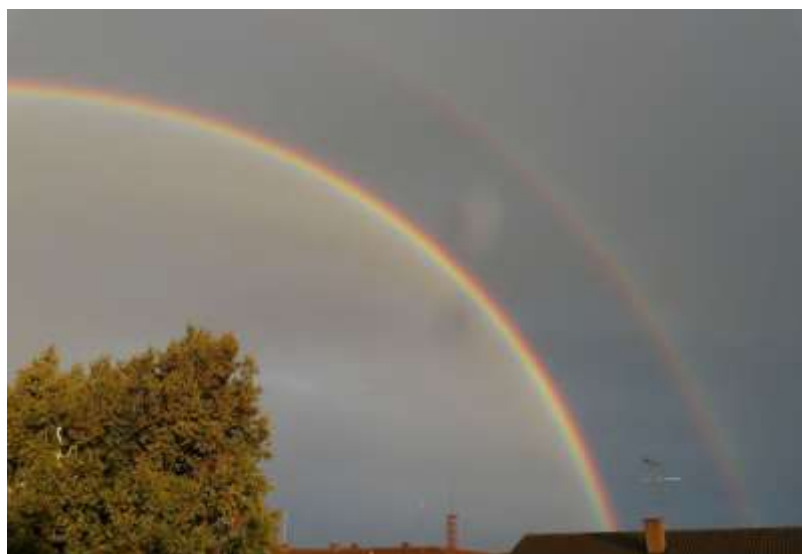
Ilustración 8 Garzas negras