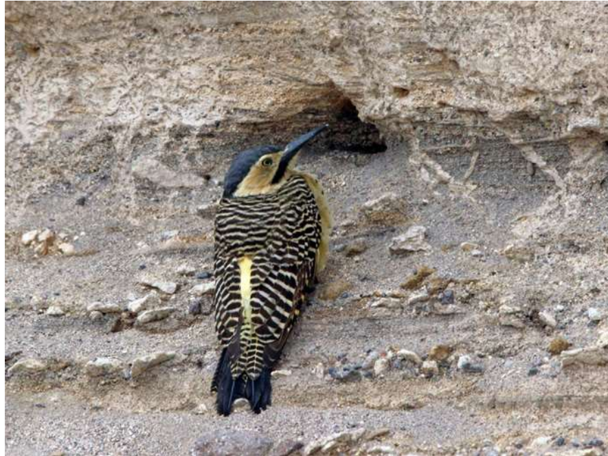
Ilustración 11 EL HAK'ACHU

se ve en esta casa de la imagen nadie vive esta abandonada desde hace mucho tiempo, los dueños disque se fueron a Arequipa, y también nos mostraron otras casas similares donde estos pobladores se mudaron a otros lugares y vienen de vez en cuando.