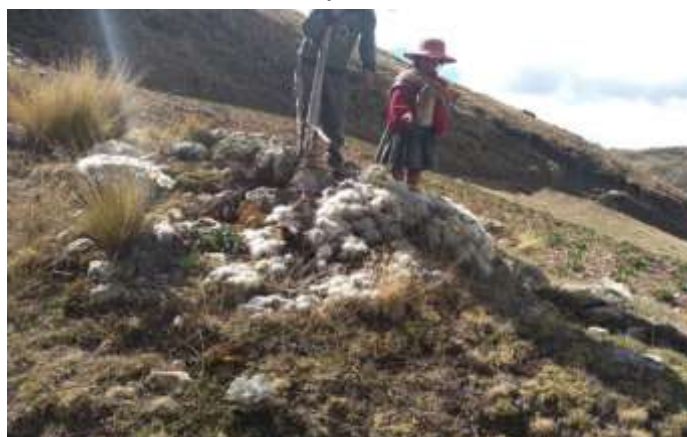
Ilustración 15 Roq'i kiska

En la comunidad de sasicancha los comuneros cuentan que un cactu llamado roq'i kiska florece de color amarillo en las épocas de sequía esto para ellos es una señal que va haber sequia e indican que va afectar a la agricultura, pero sino florecen habrá lluvias adecuadas para la agricultura y tampoco habrá mortandad de los animales, este cacto mayormente crese encima de los pedregales o los cercos de sus chacras.