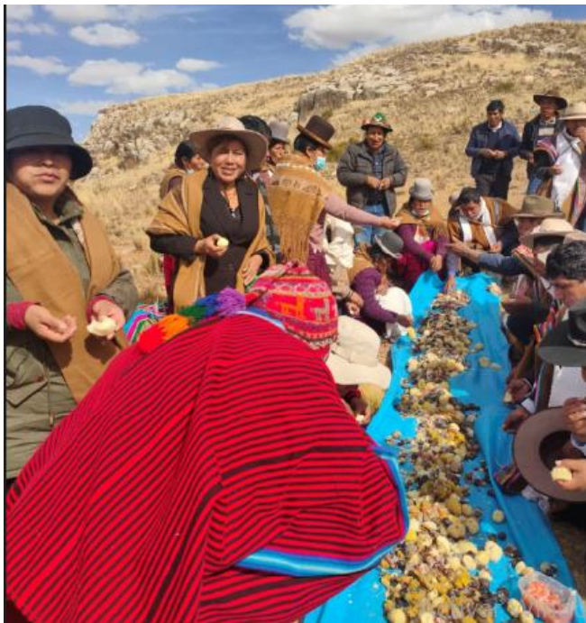
PARTICIPACION DE LOS ESTUDIANTES EN LAS ACTIVIDADES DE APRENDIZAJE POR CELEBRACION DEL AÑO NUEVO ANDINO-CHALLA A LA PACHAMAMA – FIAMBRADA COMUNAL.