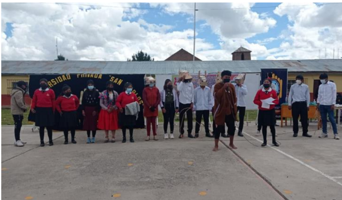
PARTICIPACION DE LOS ESTUDIANTES EN LAS ACTIVIDADES DE APRENDIZAJE POR CONMEMORACION DEL ACTO HEROICO DE PEDRO VILCAPAZA- DISCURSO DE REFLEXION