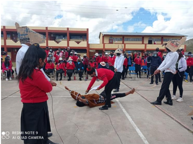
PARTICIPACION DE LOS ESTUDIANTES EN LAS ACTIVIDADES DE APRENDIZAJE POR CONMEMORACION DEL ACTO HEROICO DE PEDRO VILCAPAZA- ESCENIFICACIÓN