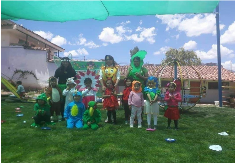
Trabajo grupal con niños y niña del jardín escolar