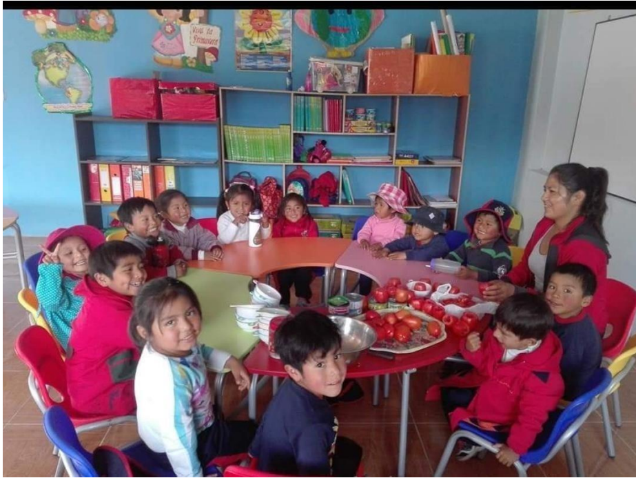
Trabajando en macro grupo y la convivencia escolar y social en el aula