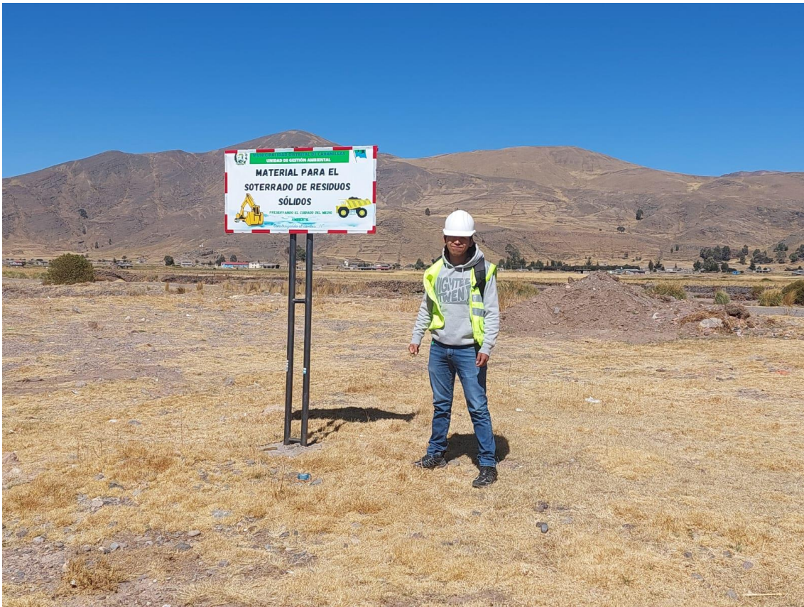
Anexo 11 Ubicación botadero a cielo abierto