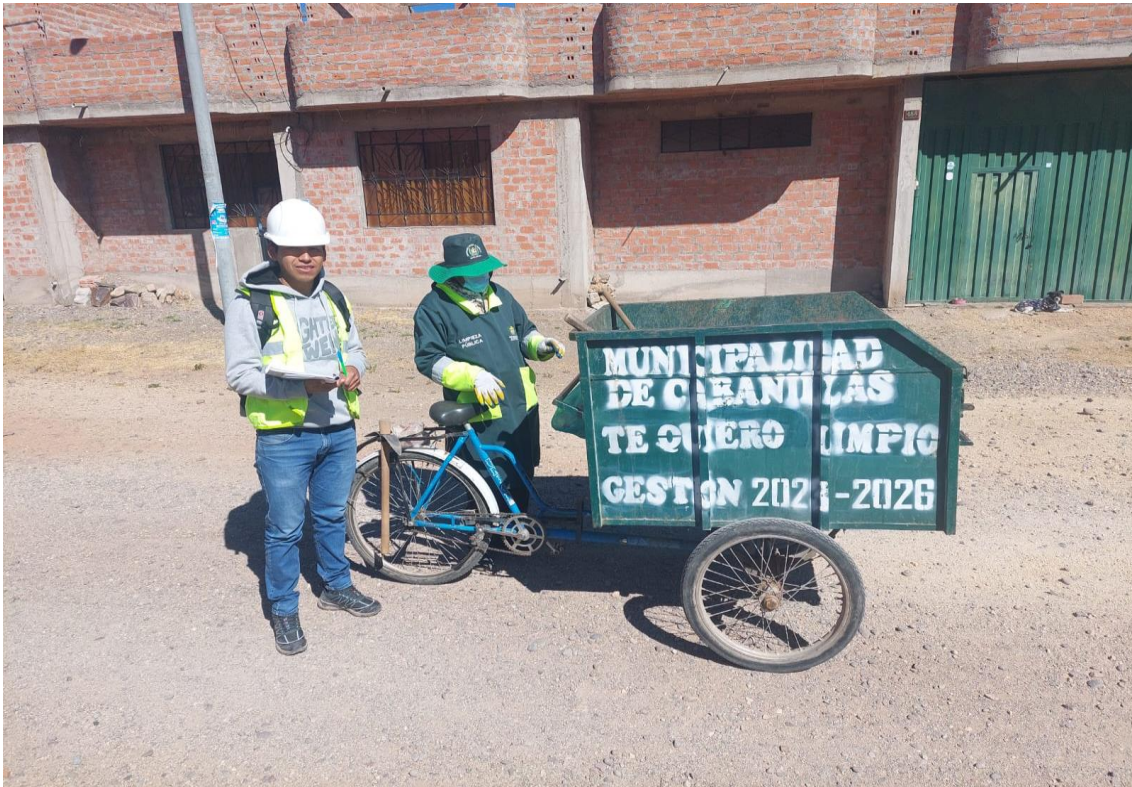
Anexo 1 Recolección de residuos orgánicos e inorgánicos en el distrito de Cabanillas