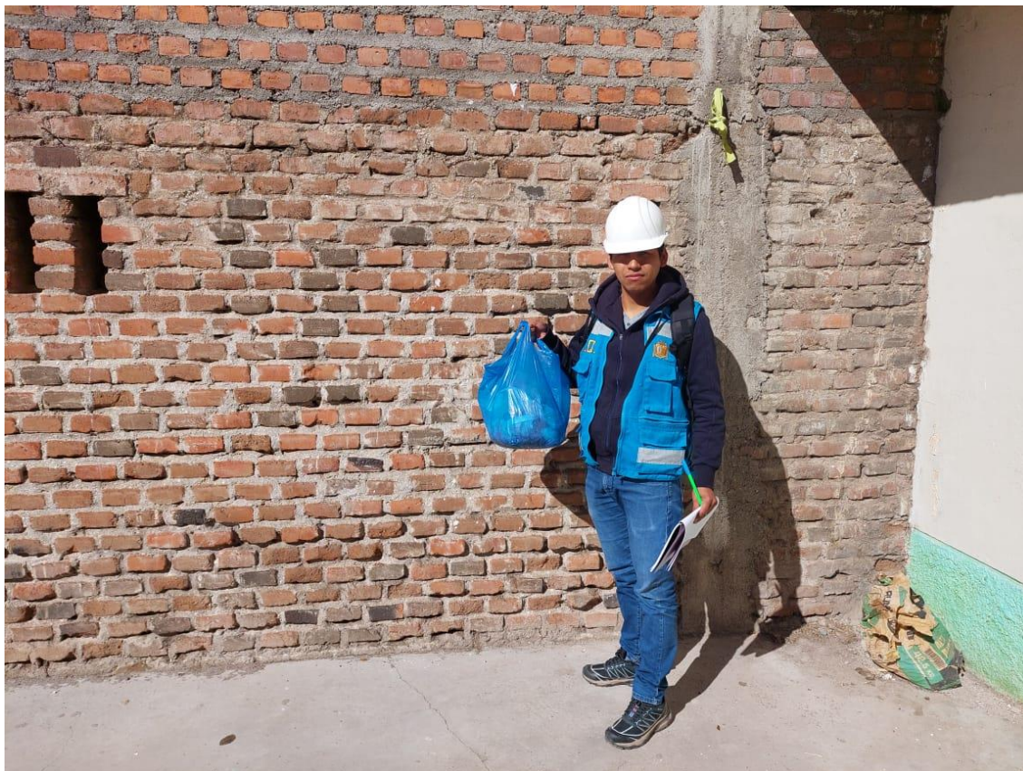
Anexo 8 Recolección de residuos Para su clasificación