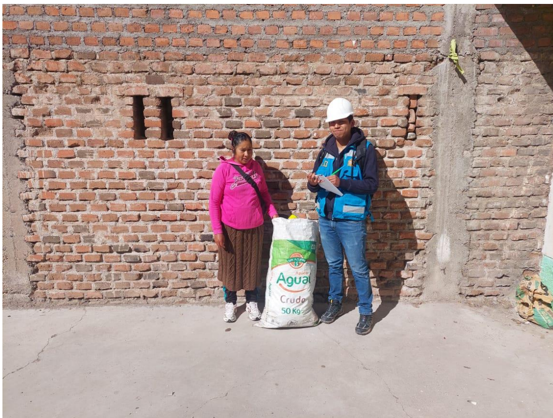
Anexo 7 Recolección de residuos domiciliarios para su clasificación