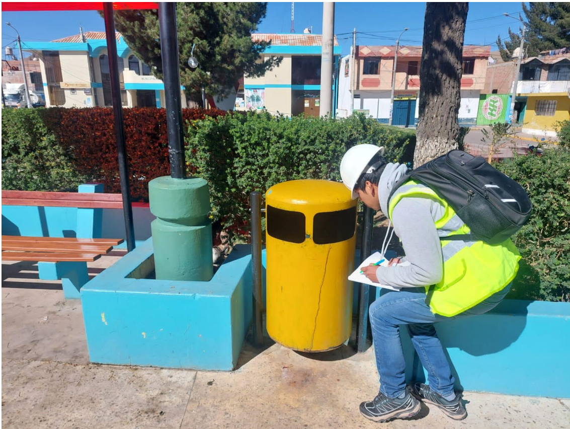
Anexo 4 Clasificación de residuos orgánicos e inorgánicos