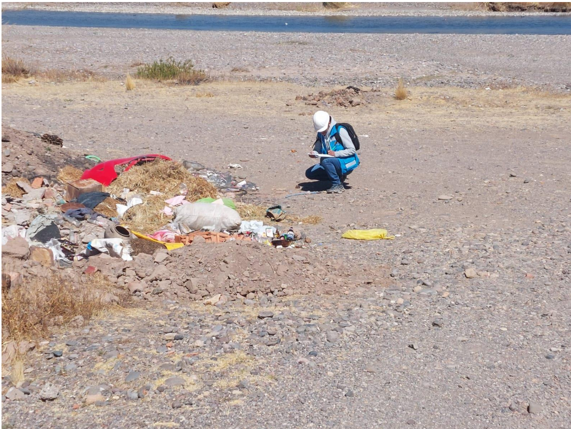
Anexo 12 Clasificación de residuos en las orillas del río