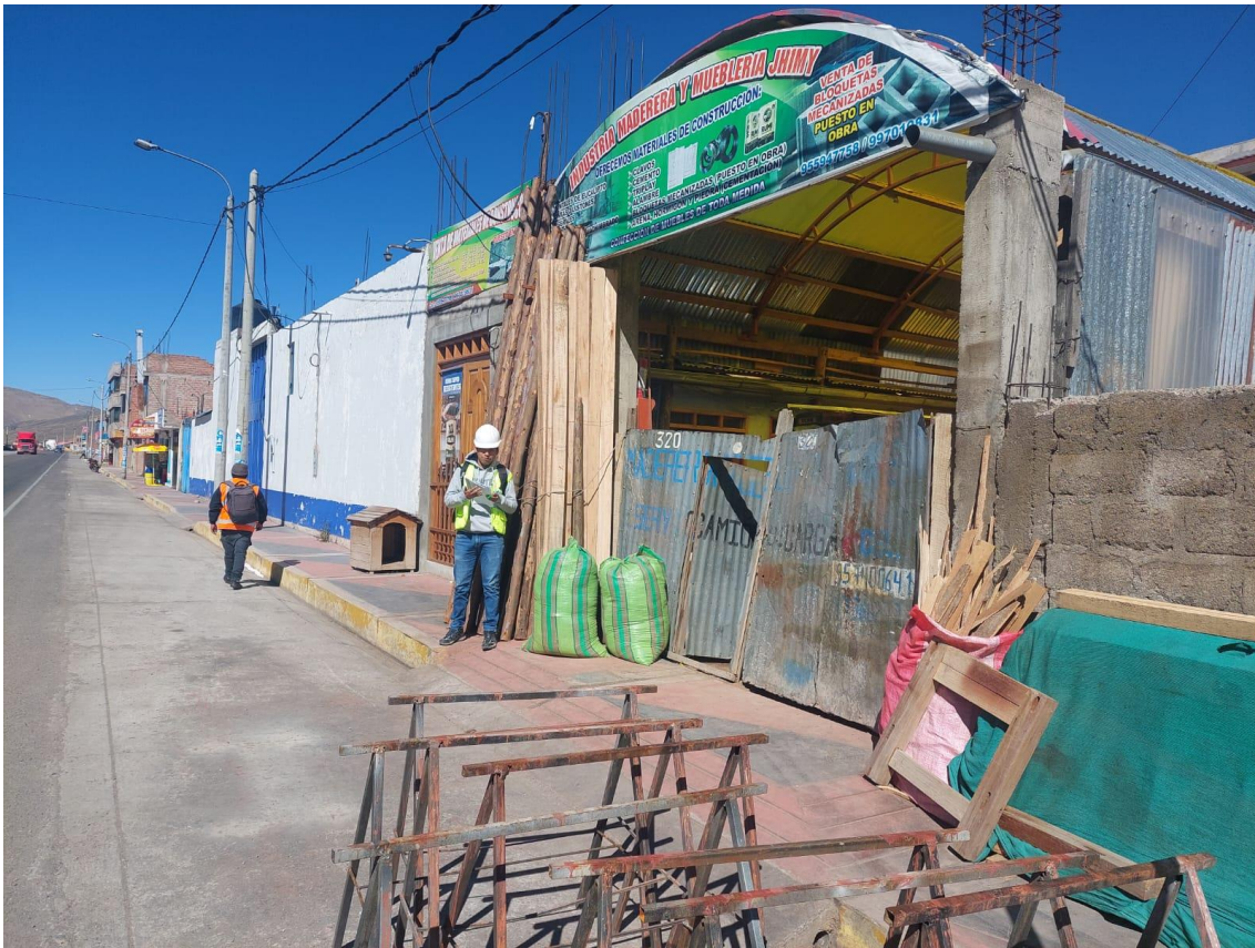
Anexo 5 Recolección de residuos no domiciliarios