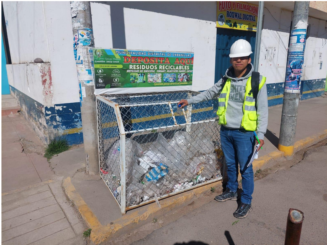
Anexo 9 Recolección de Residuos sólidos en Zona 1