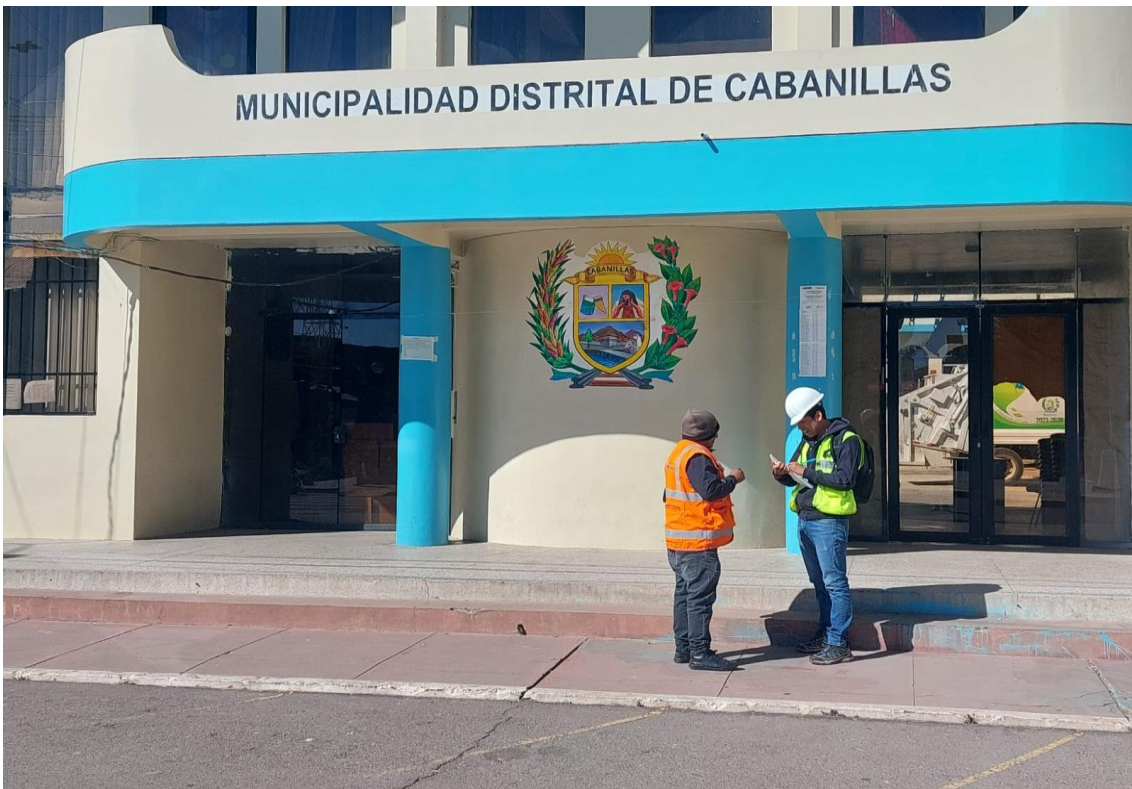
Anexo 2 Recolección de datos de residuos de la municipalidad de Cabanillas