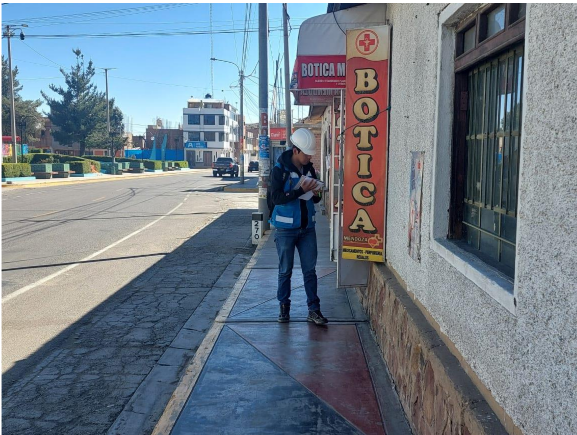
Anexo 6 Recolección de Residuos no domiciliarios para su clasificación