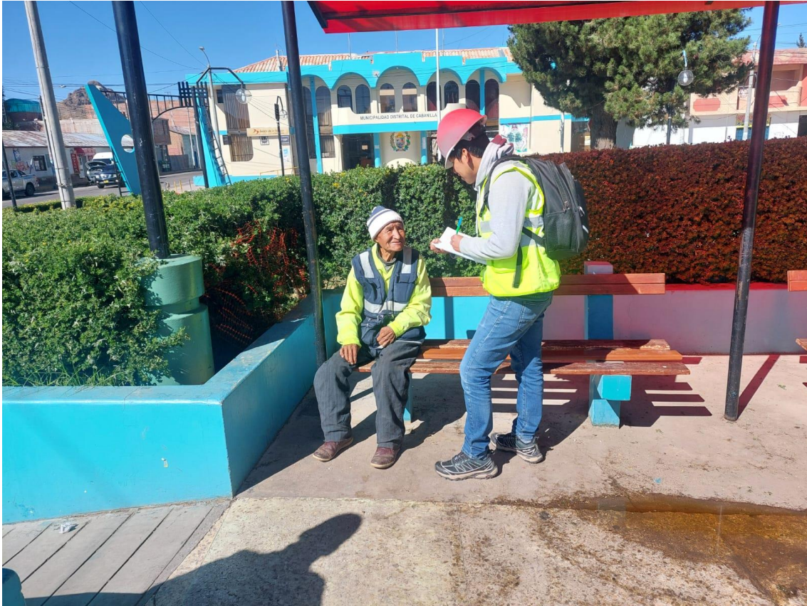
Anexo 3 Encuesta a los trabajadores de camión de residuos orgánicos e inorgánicos