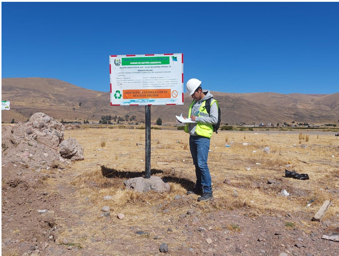
Anexo 10 Ubicación y recolección de residuos solidos