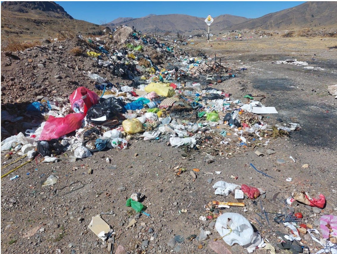
Anexo 13 Clasificación de materiales orgánicos e inorgánicos por día en el botadero a cielo abierto