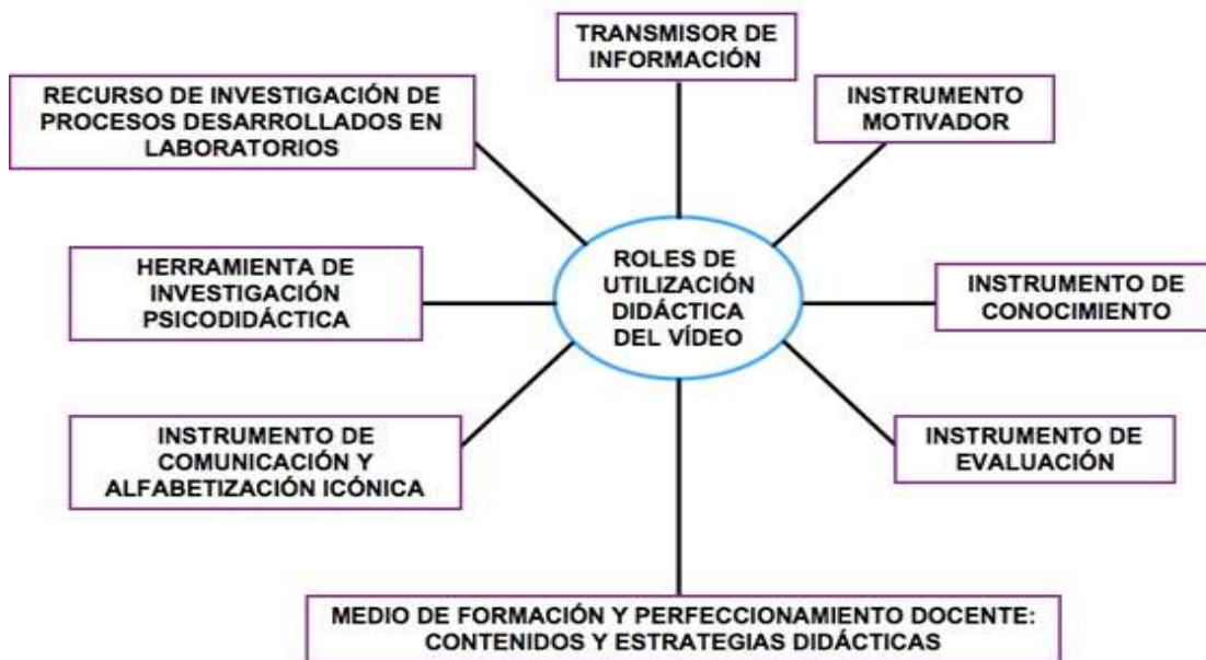
Figura 02: Video didáctico en la enseñanza de habilidades

Nota: Video didáctica enseñanza de desarrollo habilidades. Universidad del Pacífico, Lima.