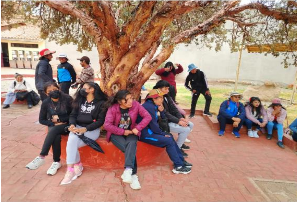
Convivencia de los estudiantes entre sus pares