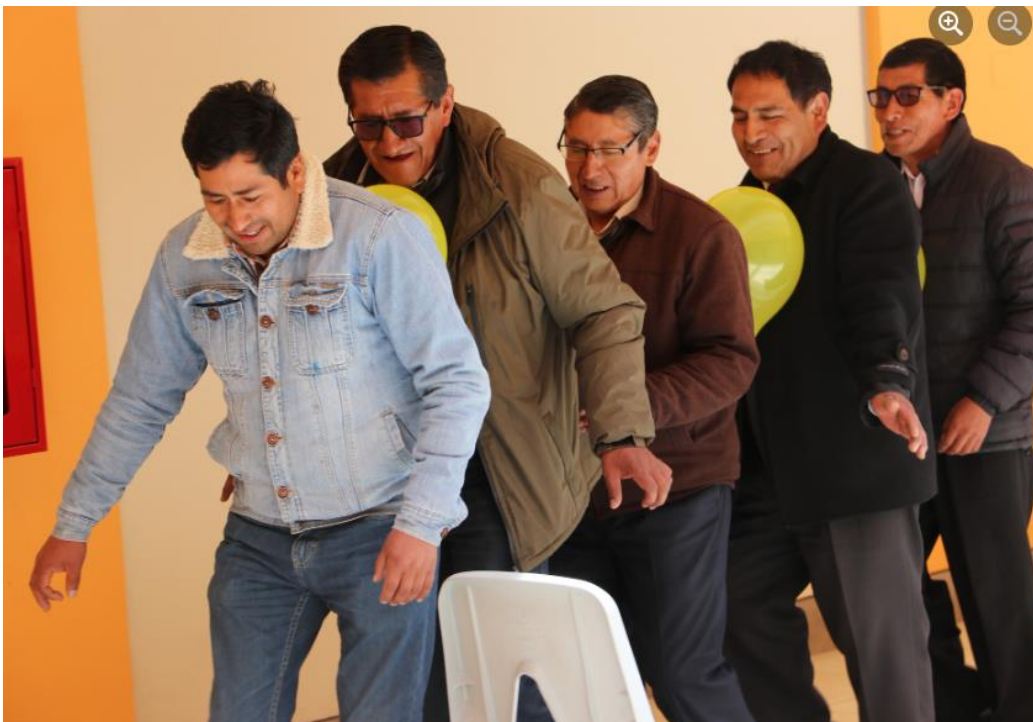
Convivencia con los padres de familia y/o parejas