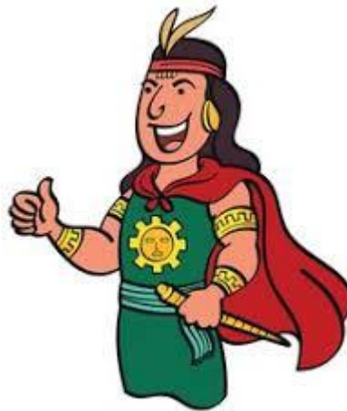
Canción del Inca